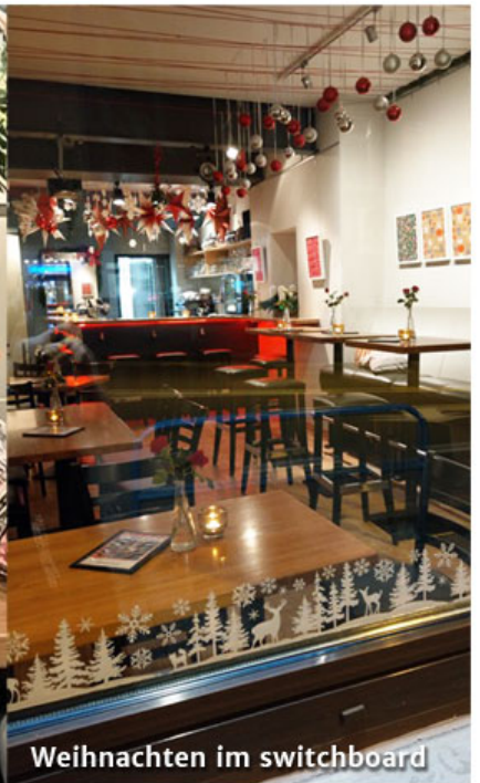
Weihnachten im switchboard