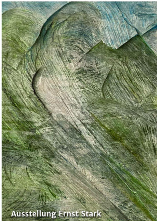
Ausstellung Ernst Stark